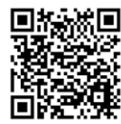
Facebook (やさしい日本語&英語)

KIEFの活動や、「金沢生活ガイド」について分からないことや、聞きたいことがあったら、いつでも電話やメールをしてください！